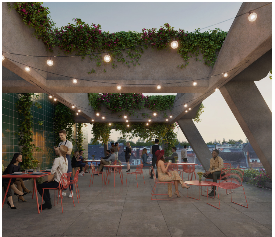
Boven op het dak komt een cultuurcafé met terras. ©Debuild-TM Archiles architecten-ebtca architecten

“Als alles goed gaat, starten we in het najaar met de verbouwingen. Met deze forse investeringen zetten we voluit de schouders onder de artistieke makers én de culturele beleving in onze stad. Ben je benieuwd naar onze plannen? Wandel dan zeker eens voorbij het administratief centrum: de bestickering wordt er vernieuwd én toont alvast wat je in 2026 mag verwachten.”