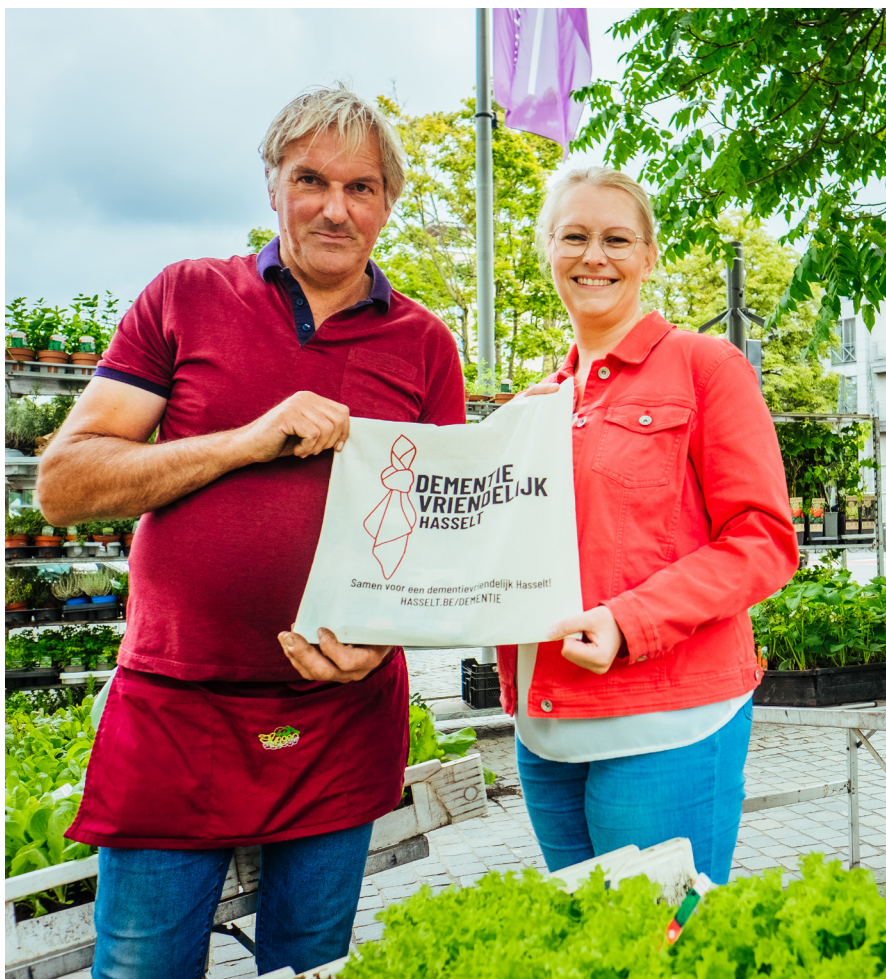
Met een nieuwe campagne leren we handelaars bewuster omgaan met klanten die verward overkomen.