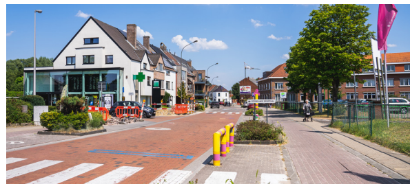
Een stuk van de Runkstersteenweg aan De Puzzel wordt een woonerf: fietsers en voetgangers mogen de volledige weg gebruiken.