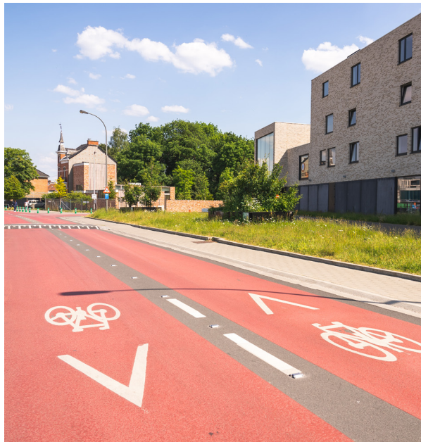
De fietsbrug loopt van jeugherberg Hostel H naar de overkant van de sporen.