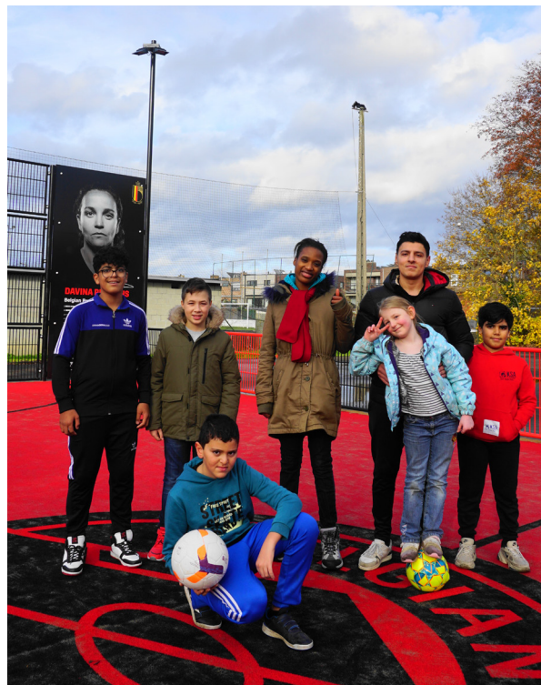
Met twee woonerven rond de sportvelden wordt de omgeving een stuk veiliger.