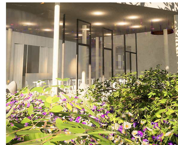
De Sint-Hubertuskerk maakt plaats voor een parkje en ontmoetingscentrum.