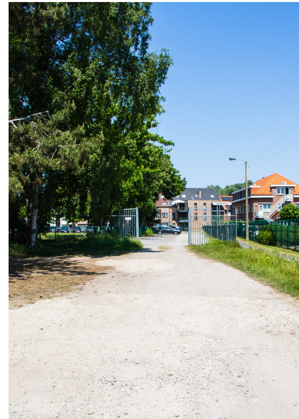
De achterkant van De Puzzel. Vandaag een grindpad, in de toekomst een overzichtelijke stopplaats voor de schoolbus en een Kiss & Ride.