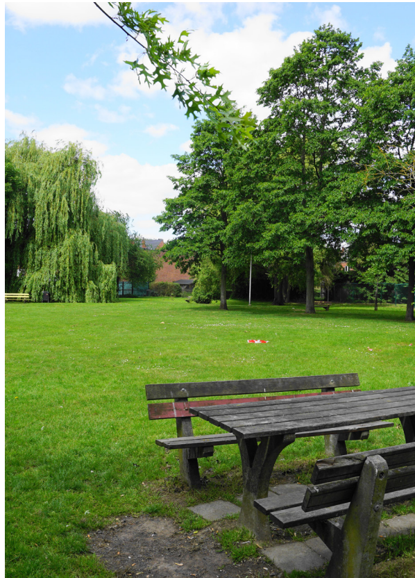
Het Rongesepark: een verborgen stukje groen.