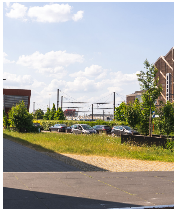
Veilig en vlot parkeren in eigen wijk, op de juiste plaats.