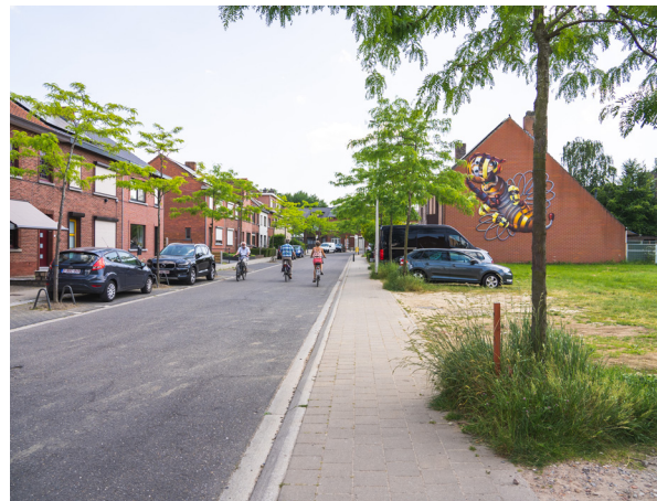
De Jagerstraat wordt een groen verlengstuk van het Notelarenpark.