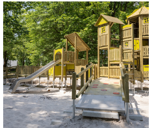
De speelburcht is rolstoeltoegankelijk via twee hellingen en heeft een extra breed plateau.

Mike uit. "En een inclusieve speeltuin moet natuurlijk een rolstoeltoegankelijke ondergrond hebben. Zand is geen optie, daarom werken we met een verharde ondergrond of kunstgras. Het was onmogelijk om het grote domein in één keer aan te pakken. Daarom werken we in verschillende fases. Fase 1 ligt het dichtst bij de ingang en richt zich op de jongste kinderen. In de toekomst voorzien we stelselmatig de volgende fases, met meer avontuurlijke zones voor de oudere doelgroep."