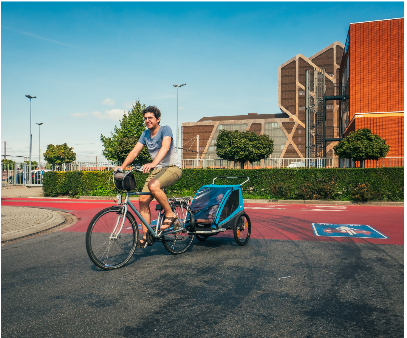
“Elke buurt heeft haar eigenheid. Daarom stemmen we onze aanpak af op de wensen en zorgen van de bewoners.”