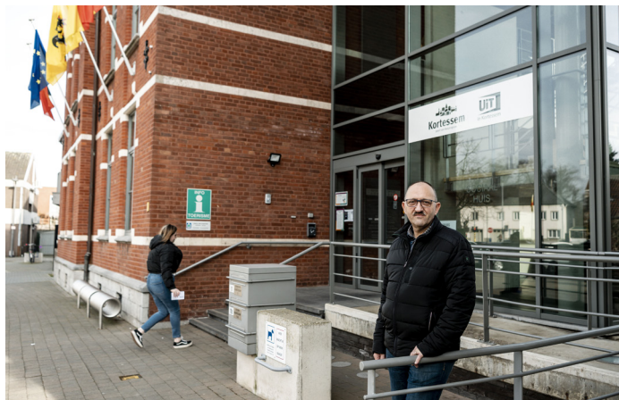
Links: de Sint-Amanduskerk in Zammelen. Rechtsboven: het Rood Kasteel van Guigoven. Rechtsonder: het gemeentehuis van Kortesseem.